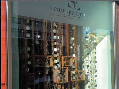
Sécurité - 100 microns incolore