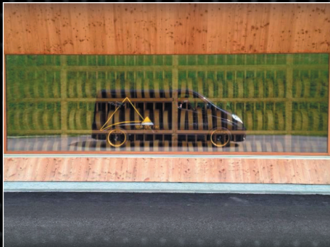
UVCL - incolore protection UV